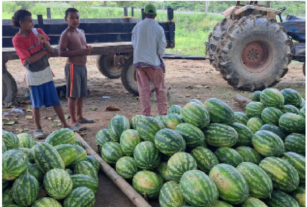
El color de la patilla mojanera contrasta con la vegetación de esta zona del país.

La patilla de la Mojana es una de las frutas más deliciosas que se cultiva en el país.