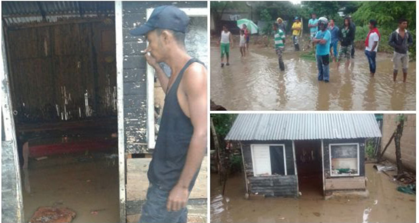
Distintos sectores de la ciudad resultaron afectados por el desbordamiento de los arroyos.

Por: Diego Hernández y Leo- La llegada de la temporada de lluvia en Sincelejo no siempre se convierte en bendiciones para los ciudadanos, sino que en algunas ocasiones es el tormento de muchas familias que pierden sus enseres por cuenta de las inundaciones.